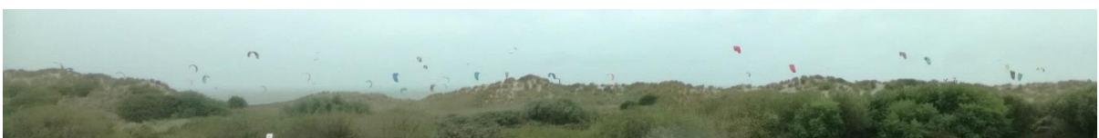
As we oer de Oosterscheldekering ride sjogge we kiteservers yn see mei prachtich kleurde kites.